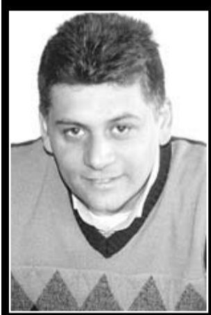
Silivri 1 Nolu Cezaevi

talimat almaz. Bu ilkelerle bir habere bakış açımız belgenin kimin arşivinde bulunup bulunmadığı değildir.