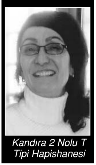
Kandıra 2 Nolu T Tipi Hapishanesi