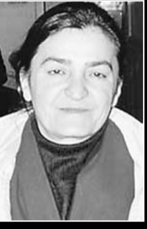
Silivri 8 No'lu L Tipi Kapalı Cezaevi

koyan yöneticilerin olmasın normal midir?