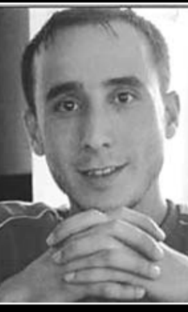
Diyarbakır D Tipi Cezaevi