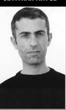
Adana Kürkçüler Cezaevi

Ama "ileri demokrasiyle" övünen iktidar, anlaşılabilir fotoğraf makinelerini molotofkokteyli, kameraları el bombası, kalemleri ise suikast silahı olarak görüyor. El insaf demekten başka ne denir bilemiyorum. Yaşadığımız bu çağda özgürlükler önünde bu kadar engellerin olması tek kelimeyle bu güzelim ülkeye haksızlıktır. Soruyorum "ileri demokrasi" diyenlere; siz ül-