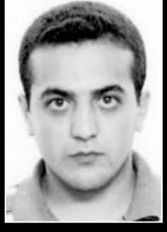
Sincan 1 Nolu F Tipi Cezaevi

zetecilere yönelik tutuklamaların artmasıyla beraber bu söz fazlaca söylenir oldu. Yıllardır devrimcilerin haykırdığı "Susma sustukça sıra sana gelecek" sloganı da gazeteciler tarafından meydanlarda haykırdı.