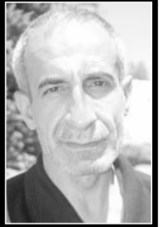
Diyarbakır D Tipi Cezaevi