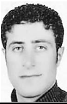
Batman M Tipi Cezaevi

O dağa tırmanmak için sabahın karanlık saatinde kalkıp yola koyuldum. Akşama kadar o keskin taşları aşarken, yağmura yakalandım. Kamera ve fotoğraf makinamın ıslanmaması için üzerimdeki gömleği çıkartıp, onları sardım. Yağmur malzemelerimi değil, beni ıslatmıştı. Ertesi gün sabaha kadar o haberle uğraştığım için yatamadım. Sabah uyumak için eve gitmiştim. Elimini yüzümü yıkadıktan sonra kahvaltı yapıp yatacaktım. O esnada haber