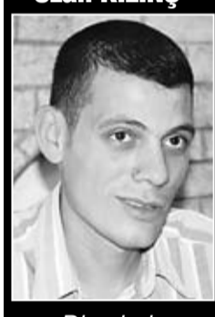
Diyarbakır D Tipi Cezaevi

alınırken ve gözaltında iken uğradığı işkenceye ilişkin İHD Amed Şubesi'ne yaptığı başvuruda basından geçenleri ayrıntılı bir şekilde açıklamıştı.